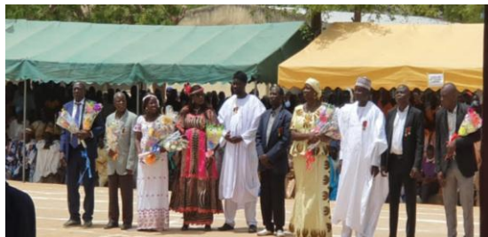
En images, le personnel médaillé de l'hôpital