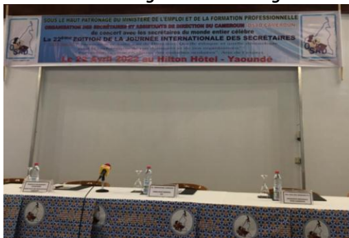
Le thème en affiche

Le thème principal retenu était « Secrétariat et Assistant de Direction : quelle éthique et quelle déontologie pour la performance de nos managers et de nos organisations ? ».