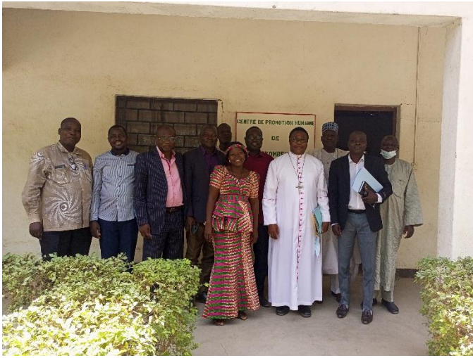
Photo de famille à la fin du Conseil