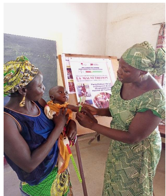
Séance pratique des prises des paramètres