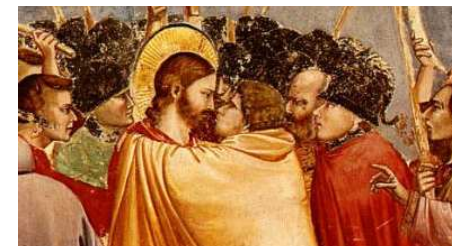
Padoue, Il Santo