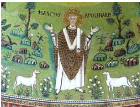
Ravenne, la grandeur du passé. Des églises des V e et VI e s. aux décors de mosaïque somptueux