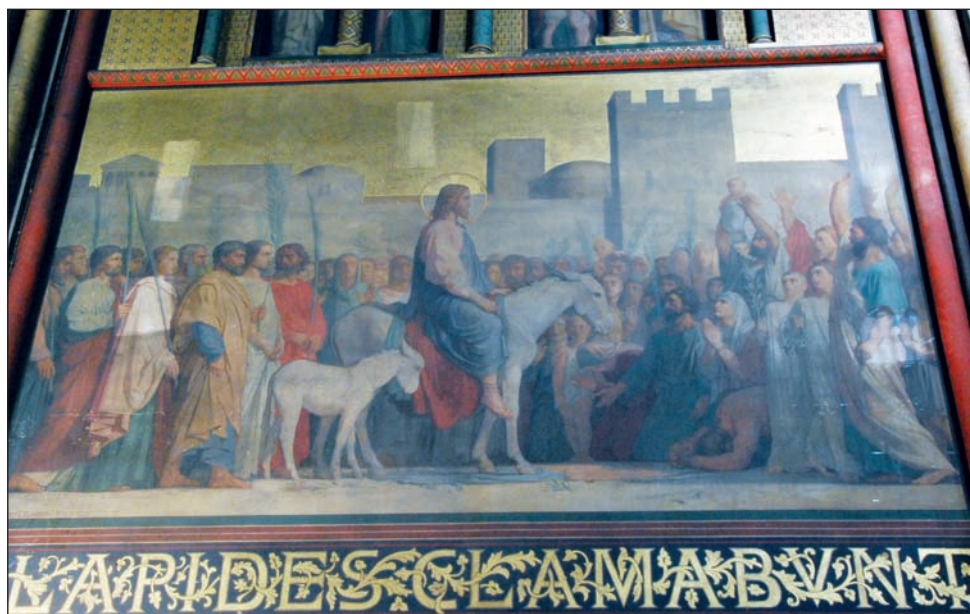
Mur nord du chœur : «L'entrée à Jérusalem» peinture de J.-H. Flandrin

La première tranche de restauration, le chœur, est actuellement en cours : dans quelques mois nous en découvrirons la splen-