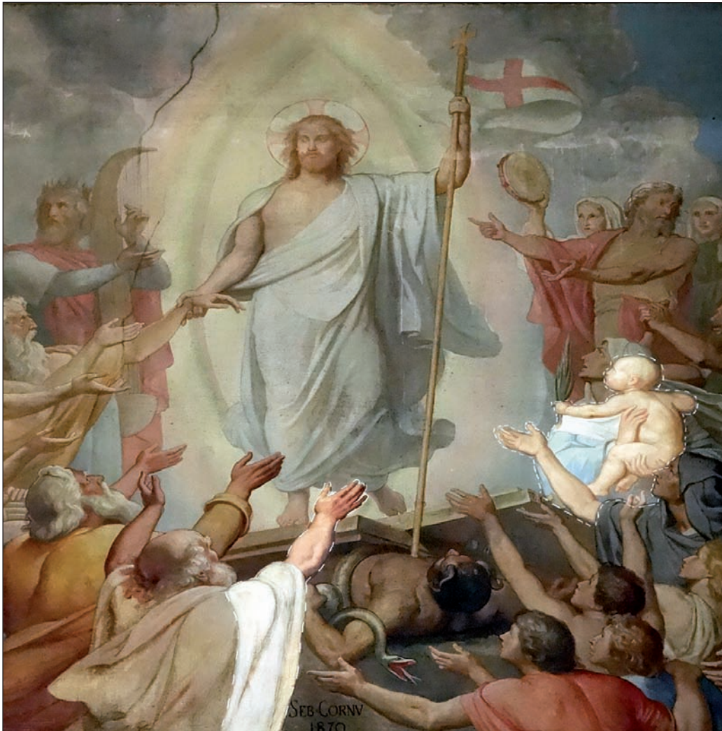
«Le Christ juge», peinture de S. Cornu dans le transept, avec essais de nettoyage.

Impressionnants échafaudages dans le chœur ! Mais quelles seront les techniques utilisées par les restaurateurs ?