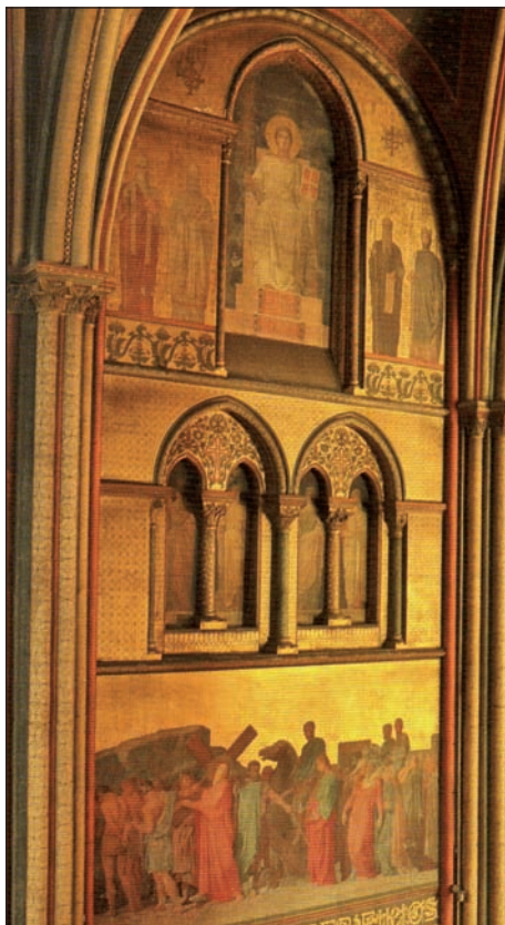
Arcature du mur sud de la travée droite