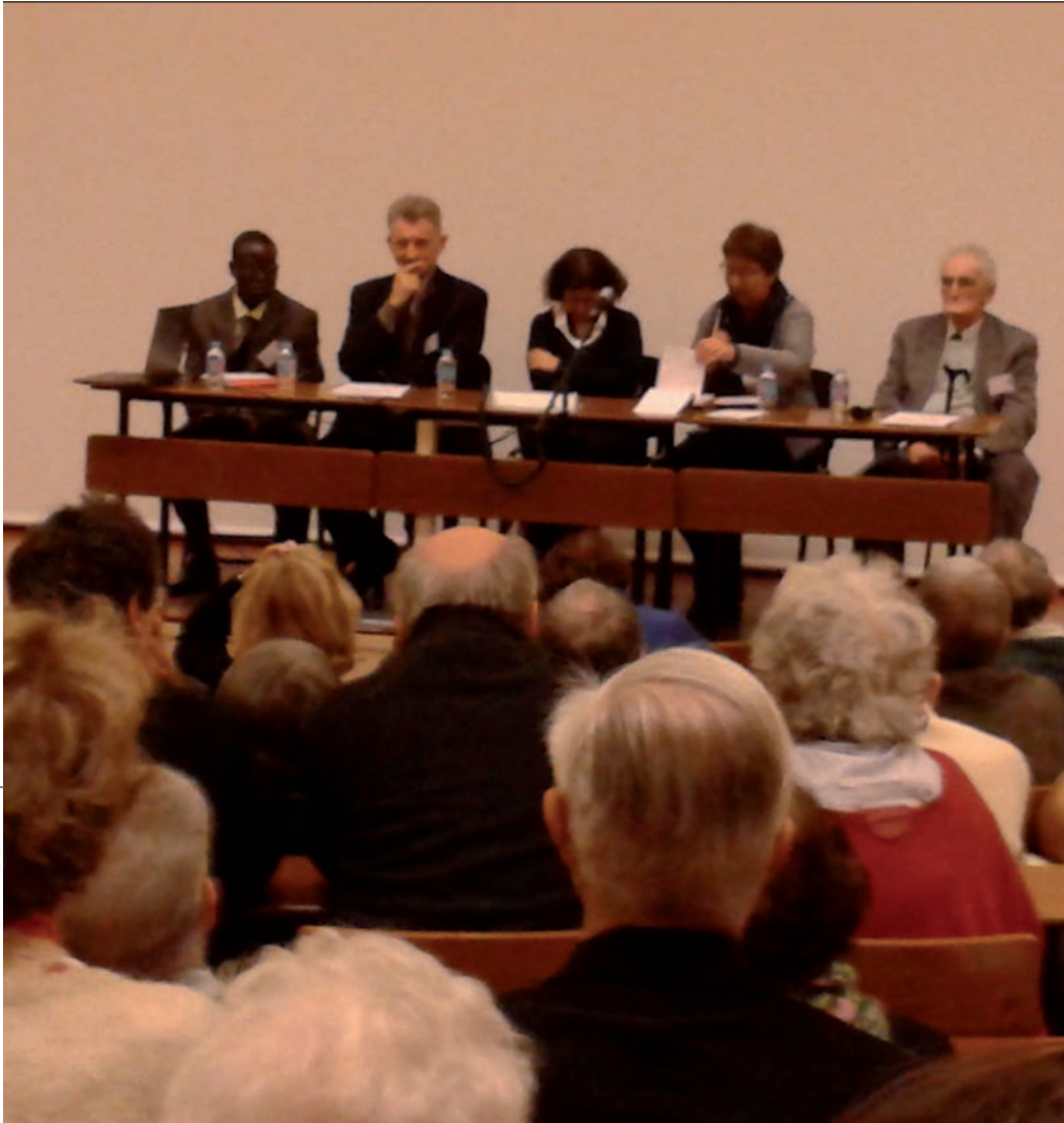
Le public était nombreux pour assister à la conférence dans l'amphi de l'IPAG

Sur ce thème, les journées des 14 et 15 novembre, reportées aux samedi 2 et dimanche 3 avril dernier, en raison des attentats de Paris, ont connu un grand succès, réunissant plus de deux cents personnes.