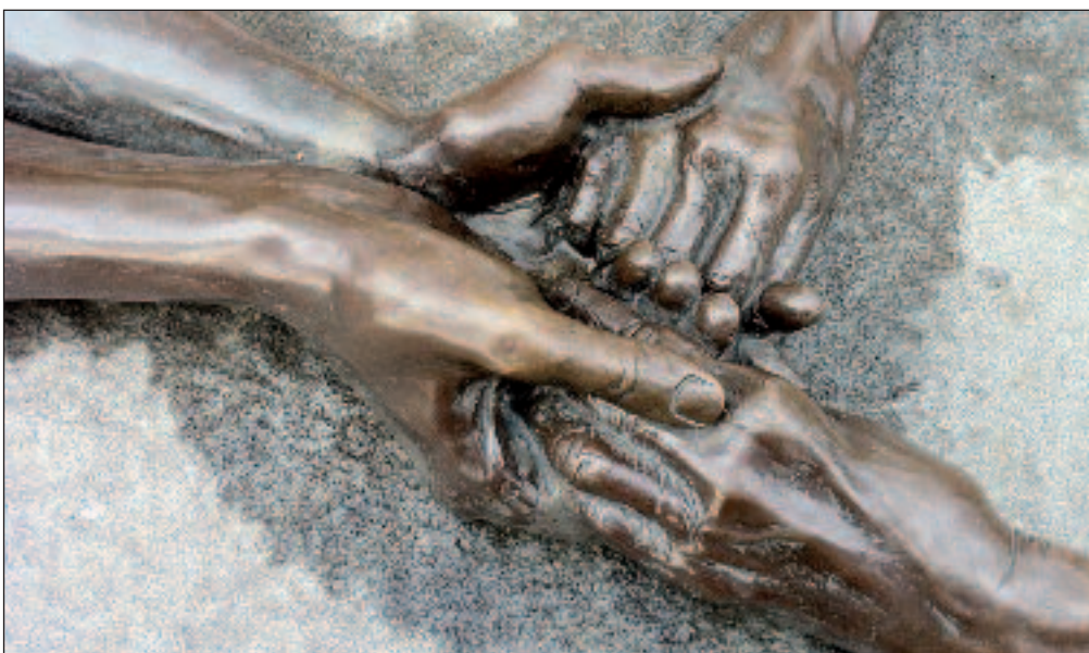
«The Welcoming Hands», sculpture de Louise Bourgeois

« Donner des frères à ceux qui n'en ont pas »