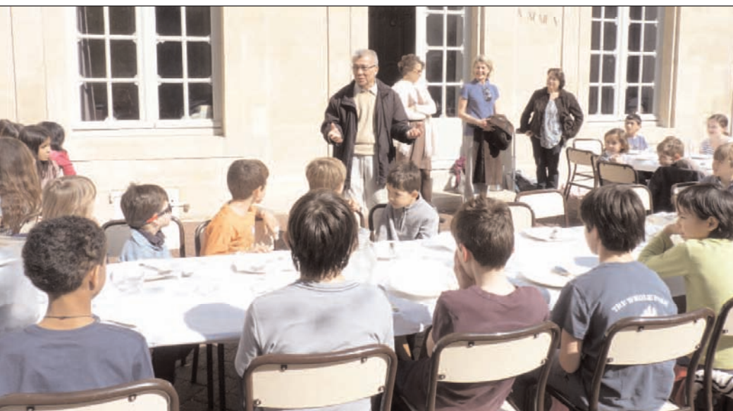
Bol de Riz enfants du catéchisme St Germain-des-Prés/St Sulpice