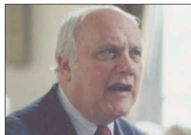
ancien curé de SGP, voir l'article page 4.