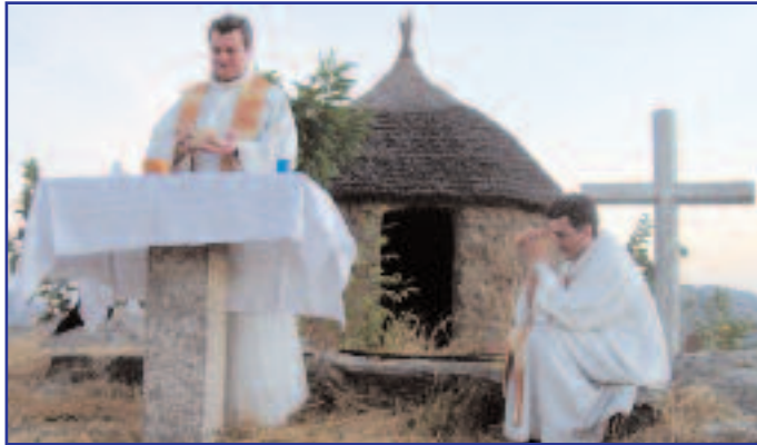
Notre curé au cours d'une messe en brousse

D epuis près de 40 ans, SGP tisse des liens de fraternité intenses avec la paroisse de St-Joseph, à Tokombéré dans le nord du Cameroun. Ici et là-bas, des hommes et des femmes, des