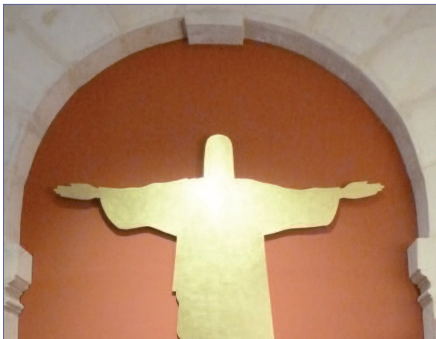
Décor mural du nouvel accueil de l'église, à gauche en entrant.