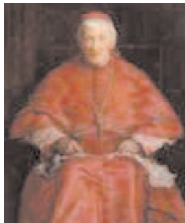
John Henry NEWMAN (1801-1890)

La pensée, la parole du cardinal anglais nous sont profondément contemporaines. L'éditorial de cette lettre reprend quelques passages d'un article signé par le Père