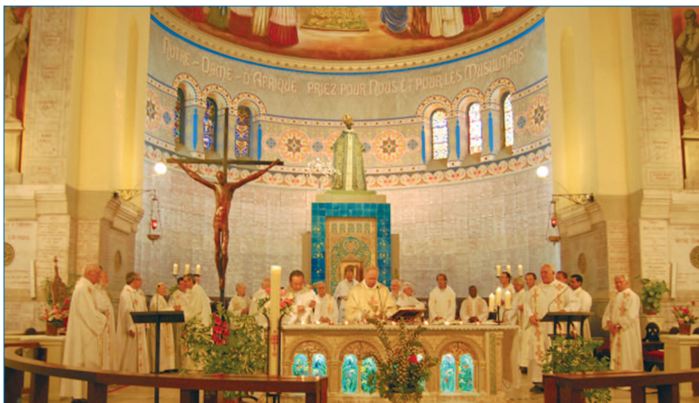
Messe à Notre-Dame d'Afrique à Alger.

Leur appel à une France qui a été trop présente pour être absente maintenant.