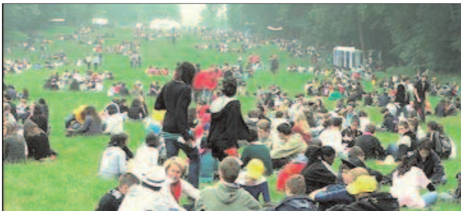
Temps des Carrefours et Veillées de réconciliation au FRAT de Jambville cette année à la fin du mois de mai.