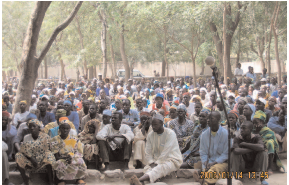
Rassemblement à Tokombéré lors d'une journée de promotion.