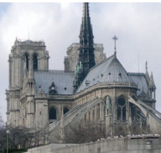
Croisière au chevet de Notre-Dame sous la bannière de l'Église de Paris.