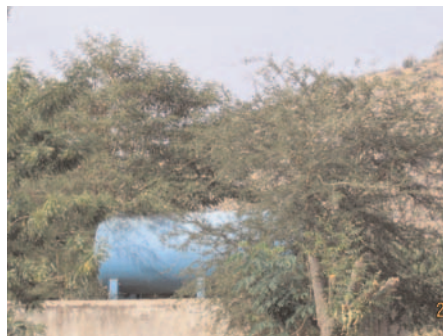
La citerne de la maison du Paysan.

vers une faille de la roche. Dans la région de Tokombéré, jamais rien n'est simple, mais les acteurs locaux sont déterminés et aboutiront. L'eau c'est la vie, et un résultat rapide est crucial.