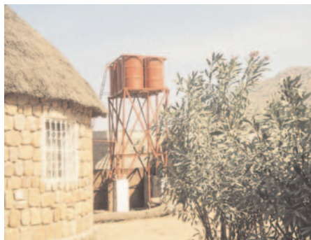
Un petit château d'eau, au Kirdi.

Le château d'eau, la citerne et les pompes sont prêts. Le forage lui-même a été entrepris et l'on a pu descendre à 55 m. Mais on est tombé là sur une roche épaisse et dure. Le géologue étudie la possibilité de se décaler à 40 m environ,