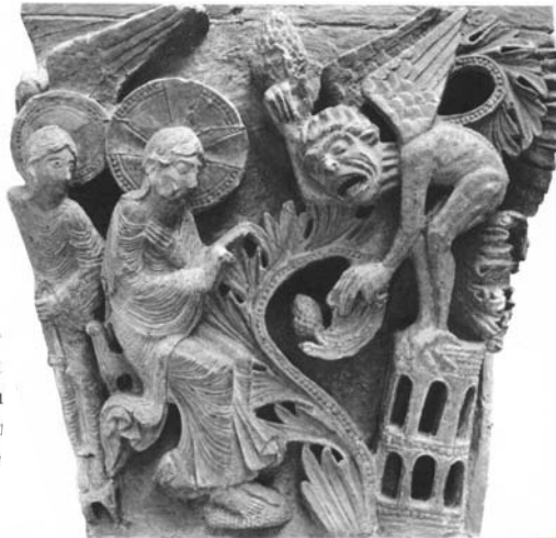
"La tentation dans le désert" Cathédrale d'Autun, XII e siècle.

Ces quarante années au désert éclairent notre propre vie. Années au cours desquelles nous avons sans doute déjà connu l'humiliation et les mises à l'épreuve. En ce carême, faisons mémoire de tout le chemin déjà parcouru et accueillons donc cette question : est-ce-que, oui ou non, j'accepte que Dieu connaisse mon cœur ? La réponse qu'il me faut envisager se trouve dans les réponses de Jésus : Dieu est la source de ma vie, Dieu est premier dans ma vie et enfin, Dieu sait ce qu'il fait.