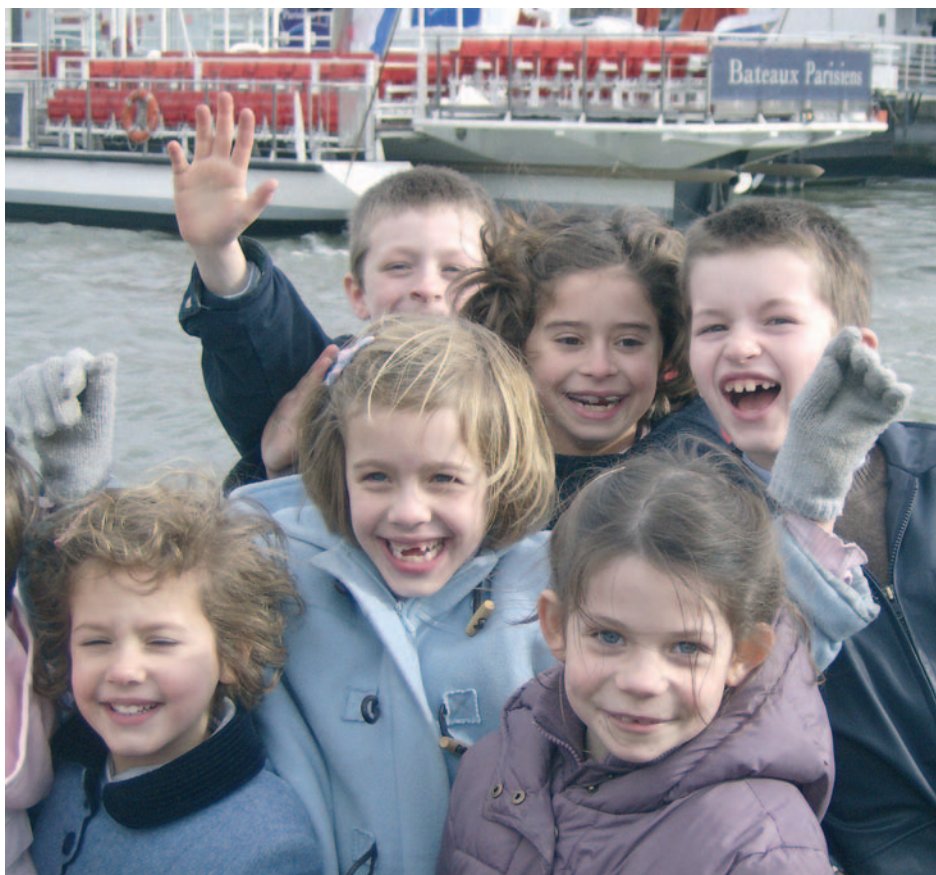
Sourires radieux des enfants embarqués sur la Seine pour leur plus grande joie

Plus de 80 paroissiens ont répondu favorablement à l'appel de Mgr André Vingt-Trois les invitant à célébrer "autrement" la Saint Valentin, les 10 et 11 février derniers. Après la messe de 10h30, l'apéritif "maison" et la croisière-pèlerinage en bateau-mouche sur la Seine, toutes les paroisses participant à ce pèlerinage se sont retrouvées à la Cathédrale Notre-Dame (comble !) pour une célébration autour de notre Archevêque.