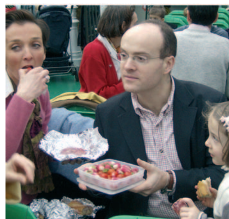
Notre curé, son vicaire et des familles de la paroisse lors du pique-nique à bord.