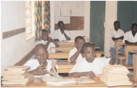
Une salle de classe du collège-lycée.