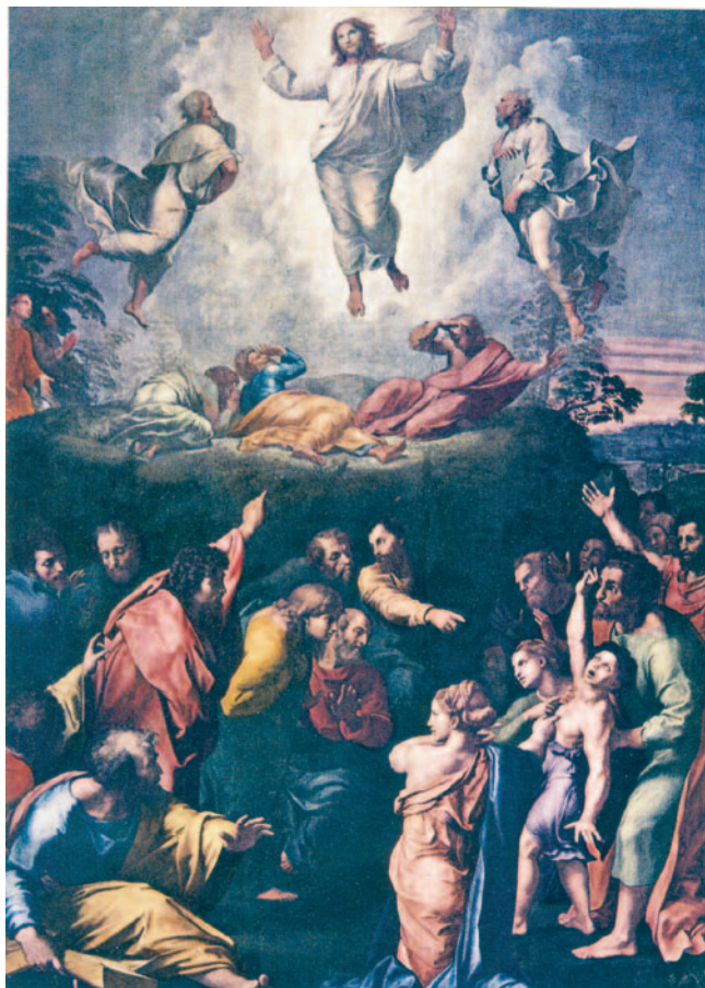
La Transfiguration par Raphaël (1483-1520) Pinacothèque du Vatican.

Quand nous mettons la tête hors de l'eau, nous voyons que ce monde en vaut la peine."