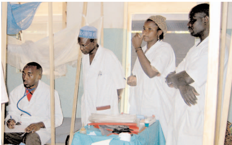
La visite du médecin à l'Hôpital.

• L'hôpital avec un dispensaire, 160 lits d'hospitalisation (médecine adulte, chirurgie, pédiatrie, maternité), un centre de réadaptation fonctionnelle, pharmacie, radiologie, échographie, laboratoire, assure des soins de 2 e échelon y compris chirurgie viscérale, orthopédique et ophtalmologique. Il est devenu hôpital de district depuis 2003. Cet établissement assure par an 34 000 consultations, 24 000 journées d'hospitalisation et 4 à 500 interventions chirurgicales.