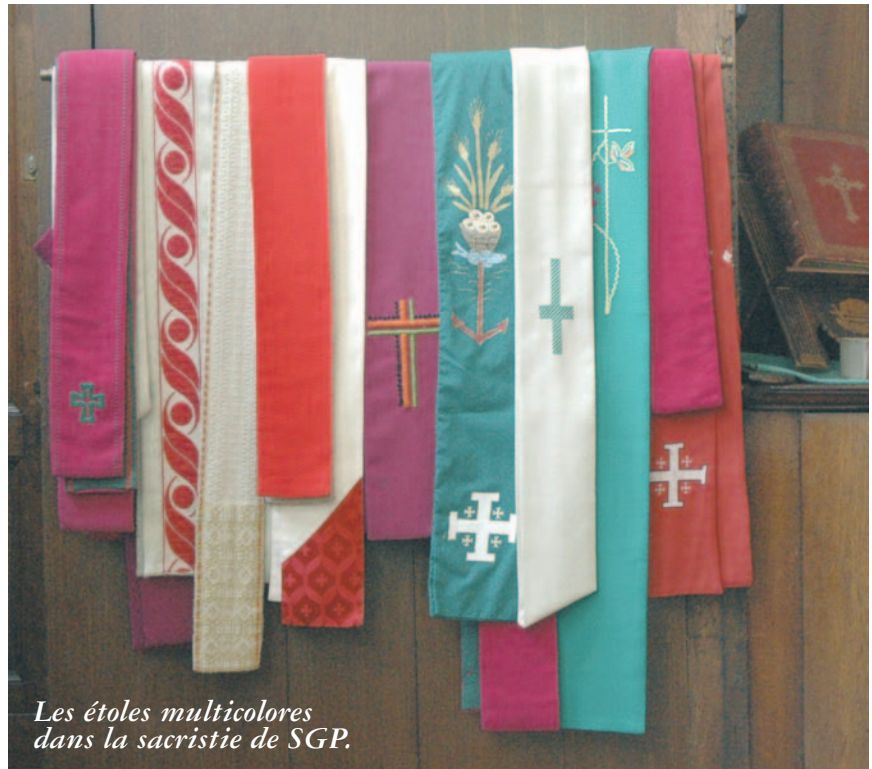
Les étoles multicolores dans la sacristie de SGP.