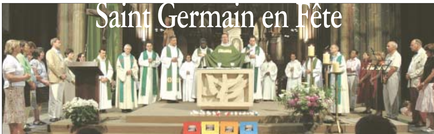
Autour de l'autel, l'ensemble des prêtre et des équipes de la paroisse