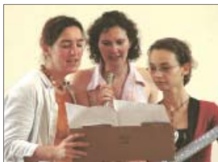
" Comme un curé aux yeux de lumière..."